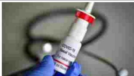
VACCINO COVID SPRAY NASALE 4

Nuovi Stati si affacciano al business dei vaccini e soprattutto alla protezione dei propri cittadini. Confermando che la sicurezza nazionale passa attraverso la sovranità vaccinale. Oltre a Cina e Giappone spuntano altri vaccini russi, turchi, iraniani e di ex Paesi sovietici. Fa capolino la Francia con Valneva e Sanofi e la Corea con GeneonLife Science. Parigi cerca di recuperare il ritardo e Seul di non essere esclusa dall'Asia dove domina in tutti i sensi l'India. New Dehli è infatti il principale produttore di vaccini al mondo e il primo alleato americano in quella parte del globo. Basti solo pensare all'appalto da un miliardo di dosi ricevuto da Johnson & Johnson. Un dettaglio che dimostra come una volta arrivati sul mercato e approvati dalle Autorità di riferimento, i vaccini dovranno superare la sfida dell'economia di scala.