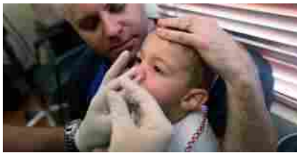
SPRAY NASALE VACCINO

Non abbiamo preso in considerazione i ritardatari ancora in Fase 1 e quei vaccini che non stanno trovando finanziamenti per proseguire la loro corsa verso la somministrazione. Un caso molto vicino a noi è quello di Reithera, ma lo stesso discorso vale per altre piccole realtà in Europa e in Sudamerica.