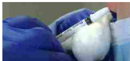
VACCINO SPRAY CONTRO IL COVID

Tutti cercano una catena logistica molto più semplice rispetto a quelle che oggi consentono le somministrazioni via hub. Soprattutto a temperatura ambiente. Solo un tipo di vaccino, che punta a essere pronto fra un anno, esce dalla modalità intramuscolare o sottocutanea. Si chiama DelNs1 ed è sviluppato dall'università di Hong kong, Xiamen, e dalla Beijing Wantai Biological Pharmacy. Batte bandiera cinese, viaggia a temperatura ambiente, si inala come un semplice spray nasale e il vettore è un virus influenzale modificato.