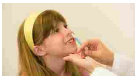
VACCINO COVID SPRAY NASALE 3

L'Europa continua a puntare tutto sugli mRNA modello Pfizer Biontech. Chissà se accetterà di buon grado l'arrivo già nel 2022 di nuovi vaccini dentro il perimetro del Vecchio Continente.