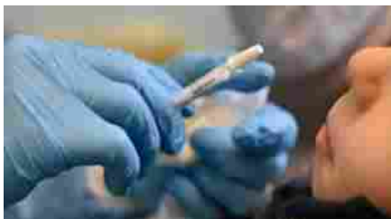
VACCINO CINESE SPRAY

Tutti cercano una catena logistica molto più semplice rispetto a quelle che oggi consentono le somministrazioni via hub. Soprattutto a temperatura ambiente. Solo un tipo di vaccino, che punta a essere pronto fra un anno, esce dalla modalità intramuscolare o sottocutanea. Si chiama DelNs1 ed è sviluppato dall'università di Hong kong, Xiamen, e dalla Beijing Wantai Biological Pharmacy. Batte bandiera cinese, viaggia a temperatura ambiente, si inala come un semplice spray nasale e il vettore è un virus influenzale modificato.